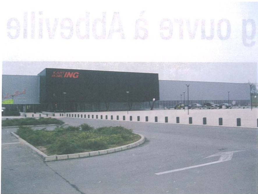
L'établissement de Jaux a ouvert ses portes en 1998.

ting-bowling-laser sur un même site en France, le plus grand complexe du Nord de la France.