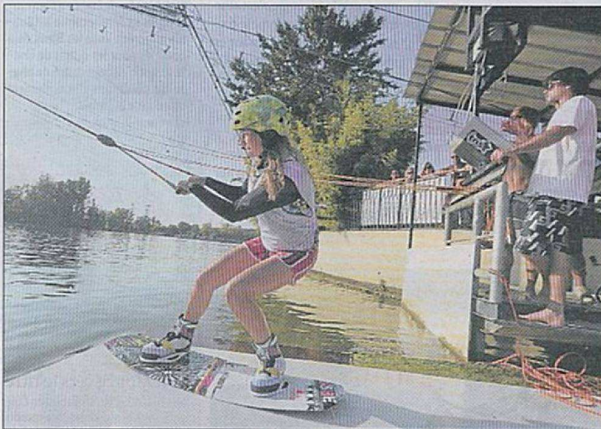
Une cinquantaine de concurrents, jeunes et seniors, dont les meilleurs spécialistes tricolores, sont attendus dans l'Oise.

« C'est vraiment tiré du snow et du skate, indique l'organisateur Bruno Giacuzzo, créateur en 2010 du « Slide nautic ». Pour l'un, le wakeboard, on a les pieds attachés