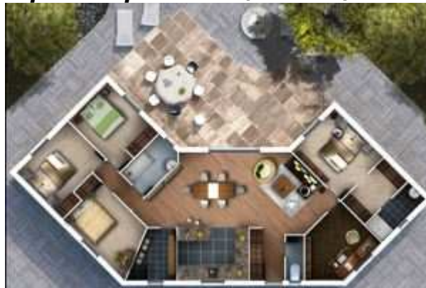
Projet AMI Bois -

F in 2011, à Vienne, le projet de construction en bois réalisé par AMI Bois et ses partenaires dont la société Pro'Fil, fabricant d'équipements innovants pour maisons dont la Pro'Fil Box, a été primé (médaille d'argent) dans la catégorie "Défi économique" aux Trophées de la maison innovante organisés par l'Union des maisons françaises. Celle-ci a récompensé à cette occasion différents projets de maisons, originaux et efficaces en matière de respect environnemental, de conception architecturale et de pertinence économique. La Pro'Fil Box équipant le projet de maison est une cellule technique qui rassemble tous les branchements et raccordements électriques, hydrauliques et de ventilation de l'habitat.