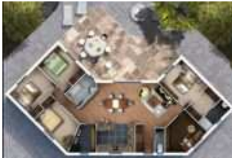
Projet AMI Bois